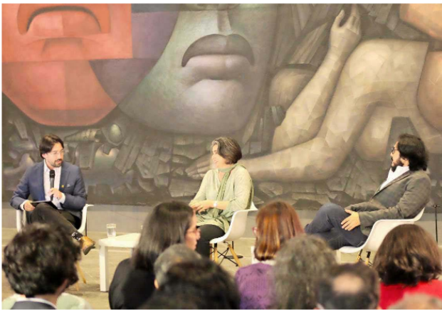
Inauguración Escuela de Verano 2024.

Una herramienta importante en este ámbito es el Fondo Concursable de Vinculación con el Medio que, dos veces al año, ofrece recursos para desarrollar