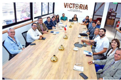
Mesa Salud en Iquique para crear carrera de Medicina.

La OFIIT u Oficina Institucional de Iniciativas Territoriales, es un programa que articula capacidades académicas y necesidades regionales. Mediante asesorías, capacitación y trabajo coordinado, ayuda a superar brechas y orientar