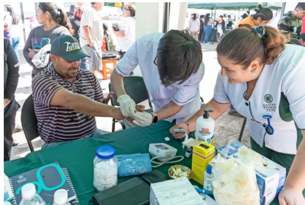
Las actividades permiten a los estudiantes poner en práctica sus conocimientos.

• Programa Emprendimiento, Innovación y Pymes: Conscientes de que —según datos de la OCDE— Chile es el país con más emprendedores, alcanzando un 16% per cápita, que aportan 17% del Producto Interno Bruto es que esta iniciativa apunta a ayudar "a la instalación de una cultura y de habilidades para la innovación y el emprendimiento en personas, poniendo énfasis en estudiantes de Santo Tomás, en alumnos de educación media técnico profesional, en empresas de menor tamaño, mujeres y personas con diversidad funcional", generando así ecosistemas que propicien la producción de soluciones innovadoras en los diversos territorios que lo necesitan y donde Santo Tomás se emplaza. El programa se encuentra en las sedes: Rancagua, San Joaquín, Puente Alto, Valdivia, Santiago CFT y Antofagasta, y está compuesto por los Proyectos Emblemáticos: Formando Emprendedor@s (Rancagua), Eje Emprende (San Joaquín), Aprende emprende