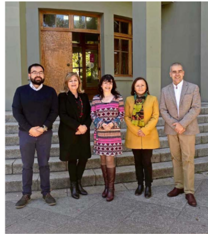
Equipo Directivo Vicerrectoría de Relaciones Institucionales y Vinculación con el Medio.

Próxima a cumplir 105 años de vida en mayo de 2024, la Universidad de Concepción hoy proyecta su vinculación con el medio como un tercer eje misional, a través de la implementación de una Política y un Modelo de Vinculación con el Medio que se condicen con los lineamientos del desarrollo institucional definidos en el Plan Estratégico Institucional, PEI(2021-2030, para la dimensión, respondiendo al objetivo de implementar modelos de diálogo y colaboración que articulen las capacidades institucionales y permitan anticipar y responder a las necesidades del medio externo. Se entiende así, como una función ligada al compromiso de servicio público que ha orientado el quehacer de la UdeC a lo largo de su historia.