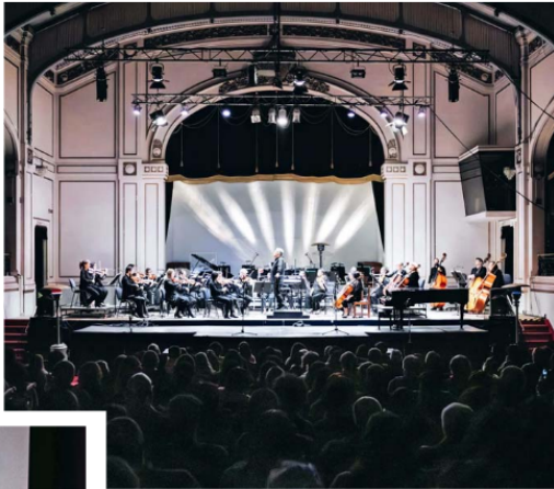
La Universidad de Santiago de Chile desarrolla una prolífica extensión académica y cultural.

profesionales y centros de formación técnica para abordar mecanismos de vinculación de instituciones de educación superior del país con su entorno.