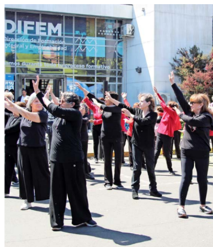
Mejorar la calidad de vida de las personas, a través de diversas actividades, es uno de los ejes de acción de la Universidad de La Frontera.

económico y educativo, sino que también promueve el acceso a actividades artísticas y culturales. Mediante elencos artísticos propios, una nutrida cartelera anual y la Sala de Artes UFRO, que ofrece acceso gratuito para todas las edades. Asimismo, la educación continua y el Instituto Confucio UFRO (con la República Popular China) contribuyen a mejorar las oportunidades educativas y culturales en la