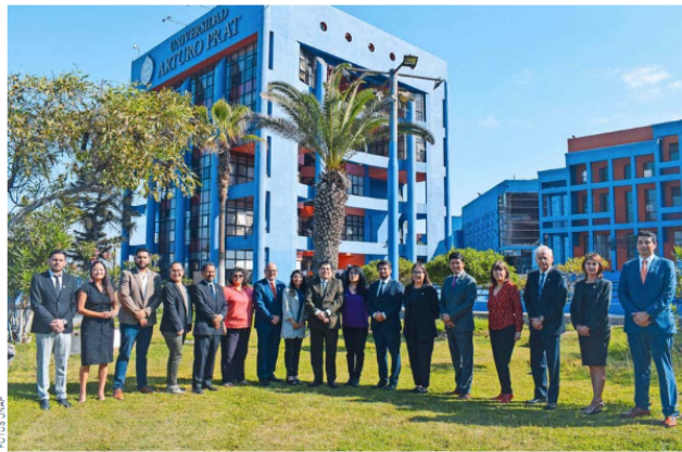
Equipo directivo UNAP.

Junto a la Docencia y la Investigación, la Vinculación con el Medio es una de las tres misiones principales en todas sus áreas y quehacer universitario