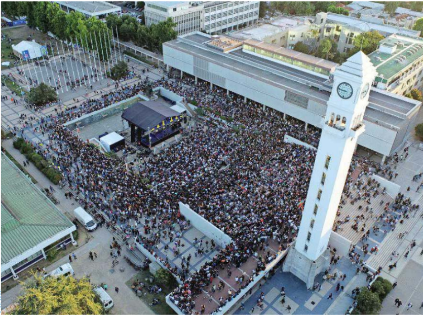
Ubicado en el corazón del Campus Concepción, el Foro Universitario reúne anualmente a una gran cantidad de personas en sus diversos conciertos abiertos a la ciudadanía.