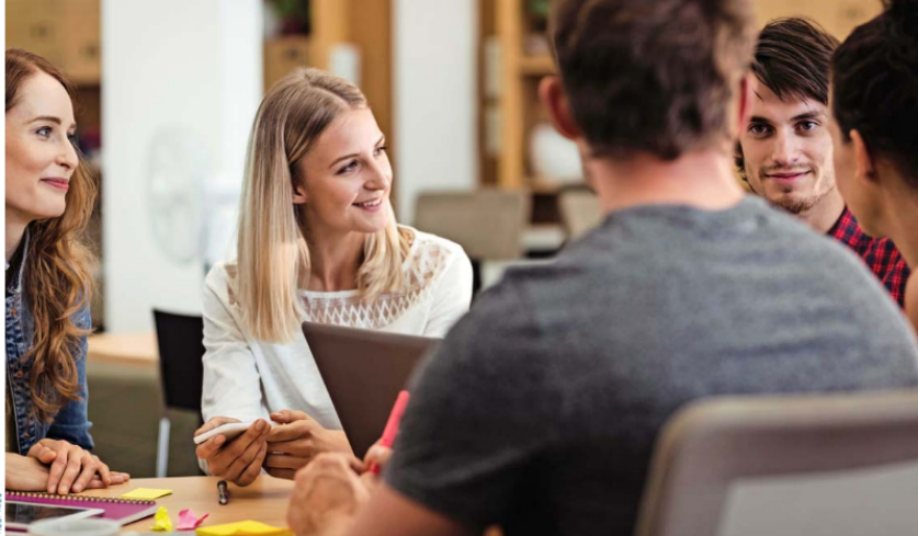
Fortalecer la relación academia-sector productivo es crucial para ampliar el impacto económico y social de las universidades

2024-2025, que tiene 4 temas: articulación con formación e investigación y la conceptualización de las acciones que constituyen vinculación con el medio externo; la medición de la contribución y/o el impacto en el medio a través de sistemas de indicadores cualitativos y cuantitativos de tal manera; el establecimiento de modelos de aseguramiento interno de la calidad en vinculación con el medio y el mejoramiento continuo, para facilitar el diálogo entre las IES del CRUCH y la CNA; y los